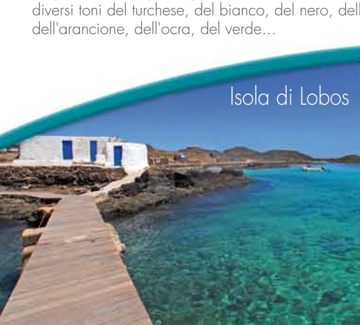
Isola di Lobos