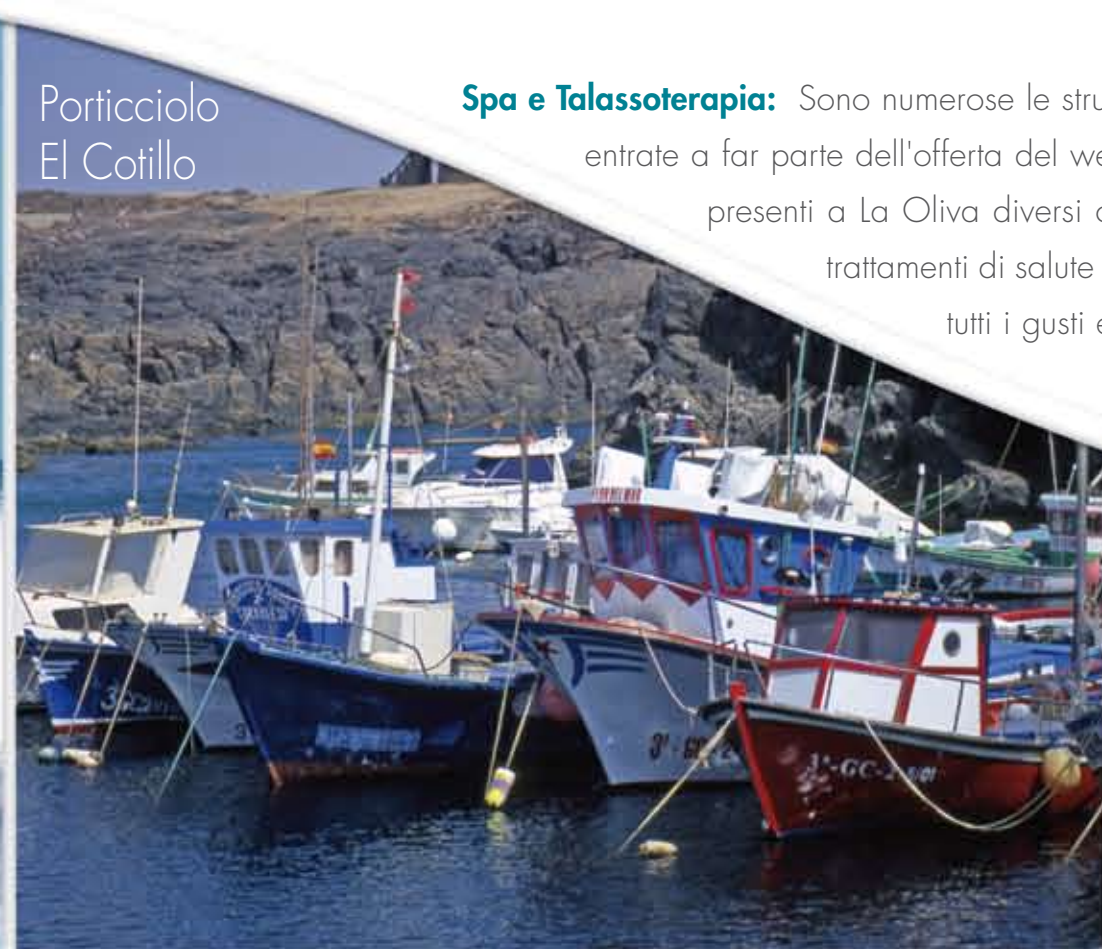
Porticciolo El Cotillo