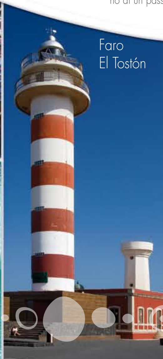
Faro El Tostón